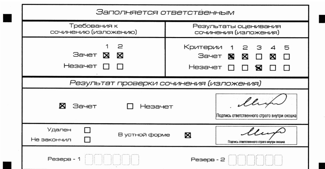
Рис. 11. Область для оценки работы сочинения (изложения) в устной форме

После окончания заполнения бланка регистрации ответственное лицо ставит свою подпись в специально отведенном для этого поле.